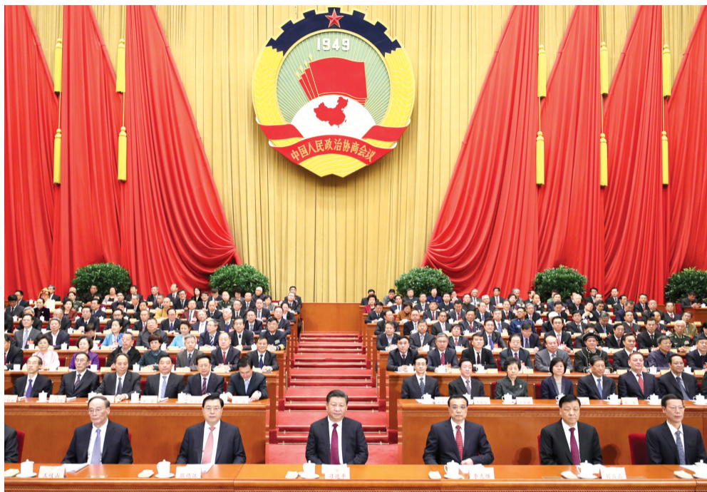
3月3日,全国政协十二届五次会议在北京开幕。图为习近平、李克强、张德江、刘云山、王岐山、张高丽在主席台就座。 新华社发

俞正声从7个方面总结了过去一年人民政协的工作。他说,2016年是中华民族伟大复兴征程中十分重要的一年。以习近平同志为核心的中共中央,勇于历史担当,保持战略定力,驾驭复杂局面,引领改革发展,团结带领全党全国各族人民,开启全面建成小康社会决胜阶段伟大进军,打响供给侧结构性改革攻坚战,取得新的显著成就。中共十八届六中全会深刻分析全面从严治党形势和任务,就新形势下加强党的建设作出新的重大部署,正式明确习近平总书记的核心地位,体现了党和人民的根本利益,对保证党