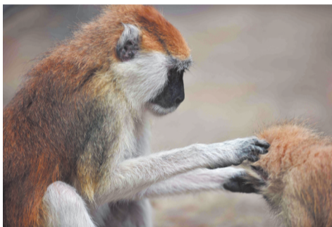
正在照顾小猴子的赤猴王