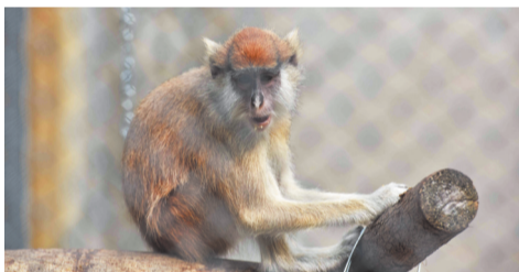
在巡视自己领土的赤猴王