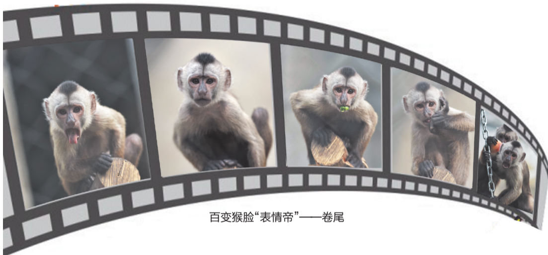
百变猴脸“表情帝”——卷尾