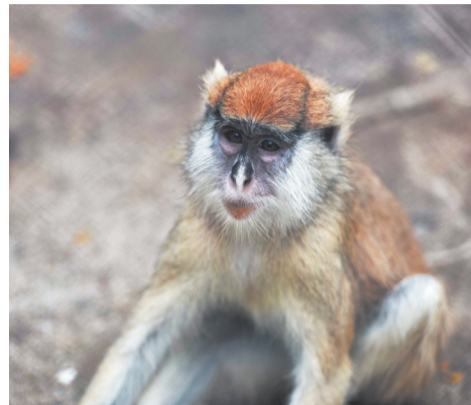
赤猴王的坐姿是不是很有王者风范？