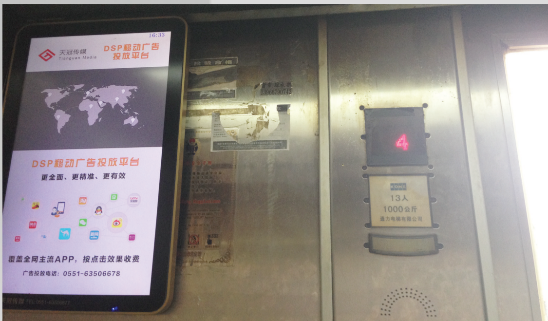
百脑汇的电梯轿厢内，未张贴今年检验标志

百脑汇商城，是合肥本地经营电子、电脑、通讯信息产品的专业化批发商城，上世纪末开业运营。尽管只有6层，但是有两部垂直电梯上下。9月6日，记者走进电梯内，发现轿厢内最显眼的是电子屏广告，看不到最新的电梯检验单，只有以前残存的痕迹。而面板上的紧急电话，虽然按上去能连通电话，但是记者等了很久，也未见另一头有应答。