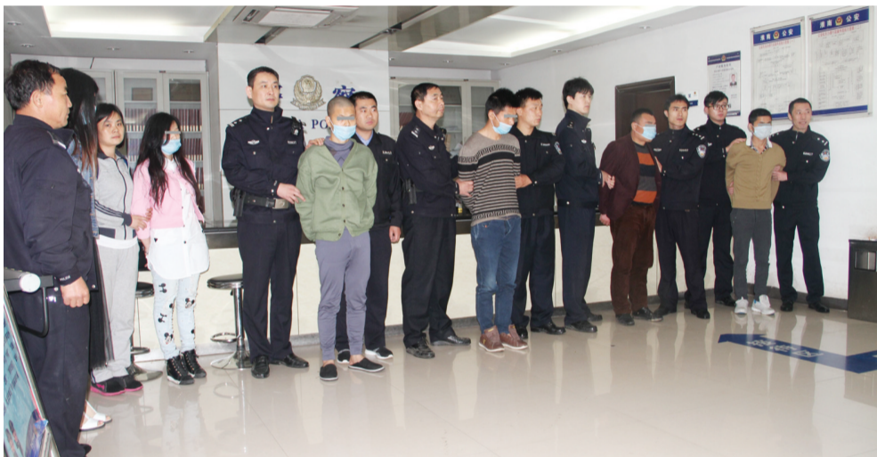
诈骗团伙押解回淮南