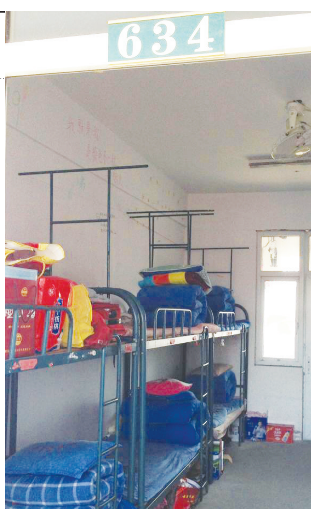
出事女生所住的寝室