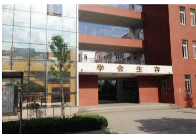
教学楼上“学会生存”的标语