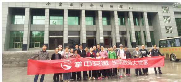
金寨县革命烈士博物馆