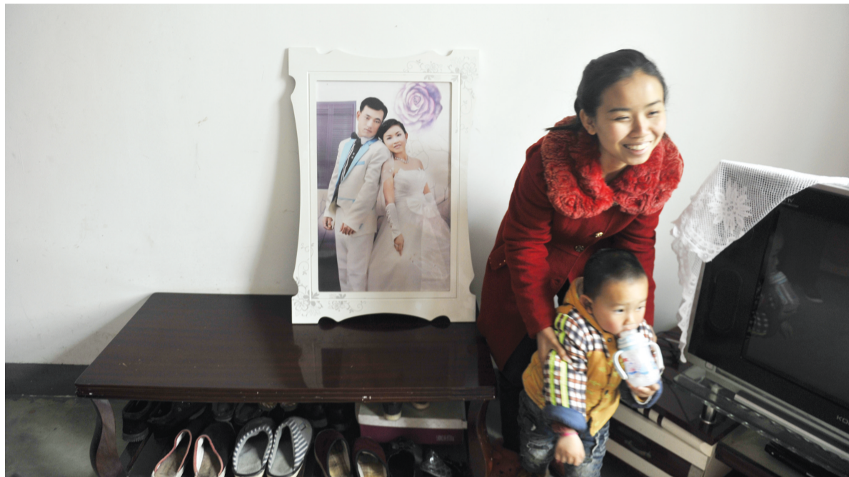
阿铜的结婚照摆在卧室，如今她已经有了自己的孩子

“外籍新娘”究竟有没有传说中那样美好？跨国婚姻带来的是幸福还是烦恼？日前，市场星报、安徽财经网记者奔赴铜陵、安庆等地，实地走访了多位老挝新娘，看看她们的生活现状，听听她们难以言说的心声。