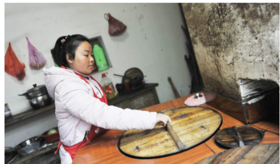
阿梦说着很不错的中文，完全融入了当地生活