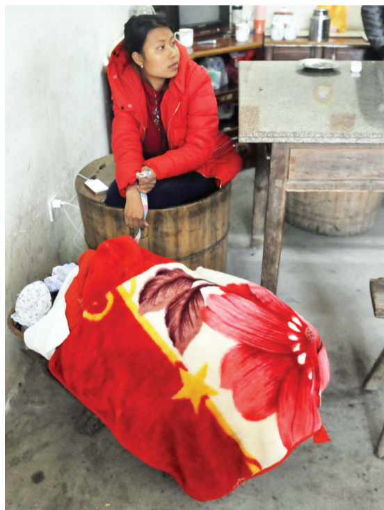
小妹刚刚生下孩子，如今她在家照顾孩子

“中国很好，什么都好，阿富人也很好。”阿铜浅浅地笑着，“想家了，我就打电话，挺好的。”