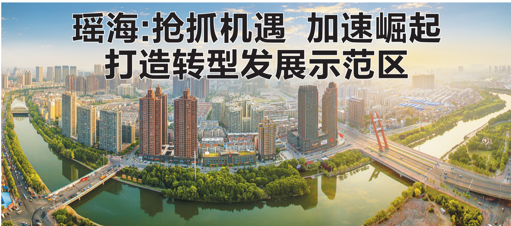
翡翠项链镶嵌的瑶海

在合肥“大湖名城,创新高地”建设的城市版图中,瑶海是独具特色的一个城区。它是合肥曾为之骄傲的老工业区,它是合肥城区发展外延最小、“内涵”最丰的主城区,它是走转型发展路线、专注向内挖潜的老城区,它也是全省人口密度最大、民生担当任重、合肥城市记忆与本土元素集中的全国老工业城区搬迁改造试点区。它是瑶海,如今,乘全国老工业城区搬迁改造试点区的东风,它正成为阔步迈向“十三五”全面振兴发展的新征程。