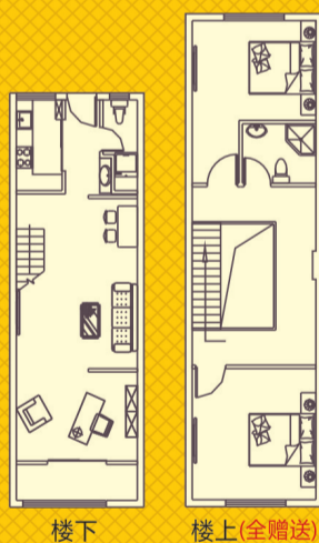
A1 建筑面积 63m 2