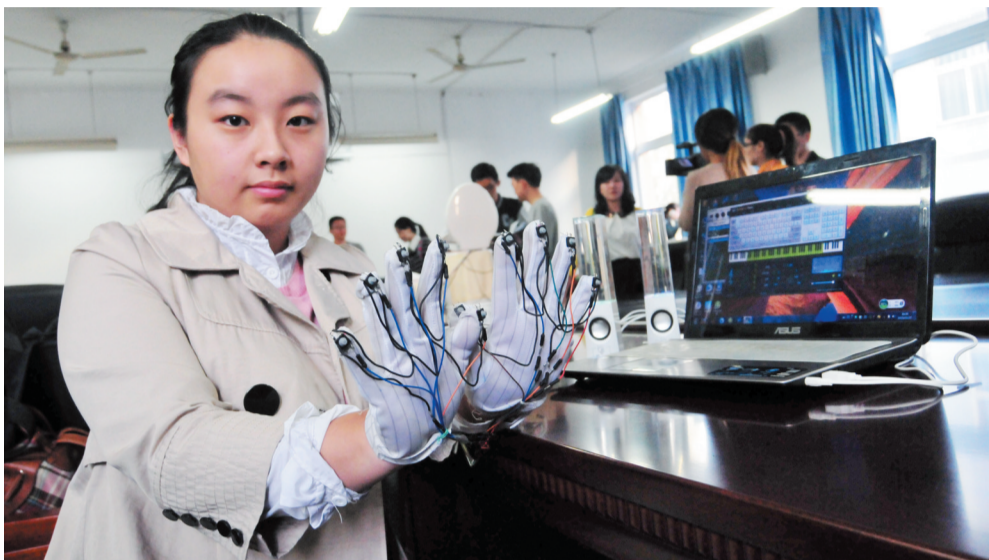
安装上芯片的手套