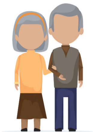
我省“医养结合” 四种新模式