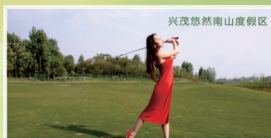
兴茂悠然南山度假区