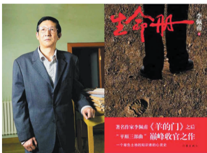
《生命册》 李佩甫 作家出版社2012年3月

《这边风景》是王蒙上世纪六七十年代下放新疆农村劳动期间创作的长篇小说,因各种缘由未曾付梓,但在《王蒙自传》和各版本评传中都有所提及,因而是一本早有耳闻却迟迟未露面的小说。小说反映了汉、维两族人民在特殊的历史背景下的真实生活,带有历史沉重的分量,又将日常生活中的生活人物塑造得极为生动,悬念迭生,独具新疆风情。