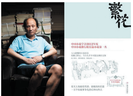
金宇澄《繁花》 上海文艺出版社2013年3月

《生命册》是李佩甫继《羊的门》、《城的灯》之后,“平原三部曲”的巅峰之作。作品从一个个典型的人物身上,从错综复杂的社会关系中,可以看到城市与乡村之间纷纷扰扰的世界,看到中原大地上五十年来生长着的苦难和血泪,这是展示,是审视,是推敲,也是追问。