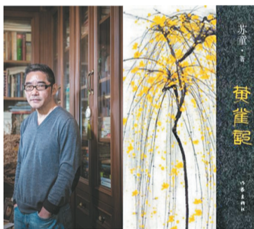
《黄雀记》 苏童 作家出版社2013年8月

《繁花》是一部地域小说,也是一部记忆小说,叙事在两个时空里频繁交替,传奇迭生,延伸了关于上海的“不一致”和错综复杂的局面,小心翼翼的嘲讽,咄咄逼人的漫画,暗藏上海的时尚与流行;昨日的遗漏,或是明天的启示……即使繁花零落,死神到来,一曲终了,人犹未散。