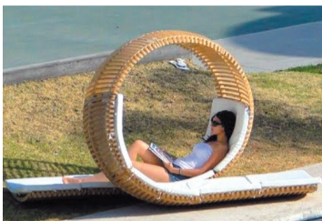
创意双人椅，想要一个