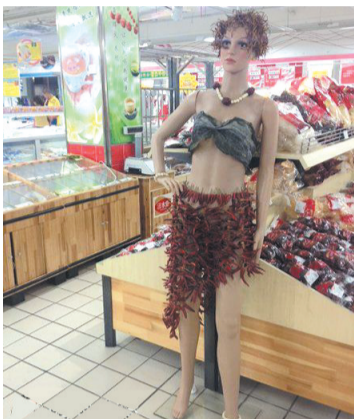
超市大妈又有神作了