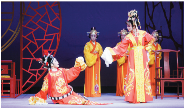
6月11日,越剧版《女驸马》安徽“汇报”演出