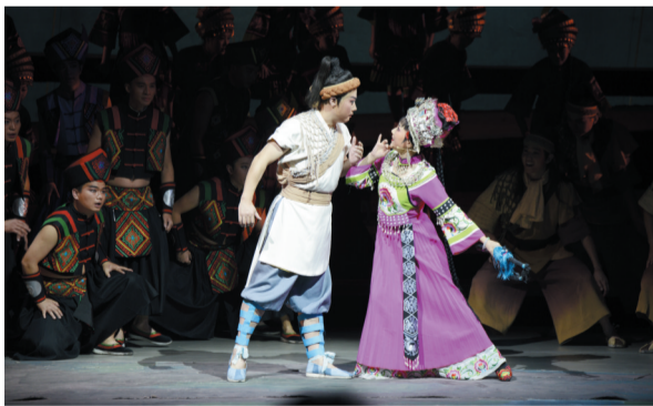
6月4、5日,黄梅戏经典《妹娃要过河》演出现场

合肥已经进入“大湖名城”时代,人们的文化生活需求也更加多元。为了丰富这座城市的内涵,倡导文化传播,市场星报首次尝试联合演艺文化,与安徽大剧院合作推出经典黄梅戏剧《妹娃要过河》、越剧版《女驸马》等传统演艺项目,给省城市民带来具有中华特色的文化节目;更邀请到中央民族歌舞团带来《色香味全》青春歌舞秀,将各民族的歌舞艺术展现在合肥观众面前。