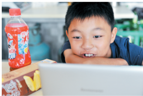
由于没有什么小伙伴，看动画片成了主要的娱乐