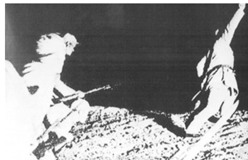
新四军伏击合肥至安庆的日军运输线