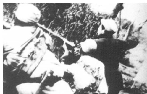
战斗中的新四军二师战士