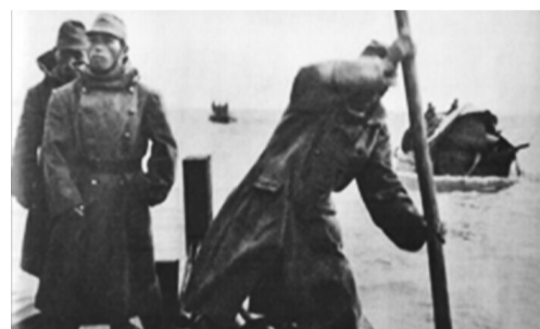
日军在巢湖上的巡逻队