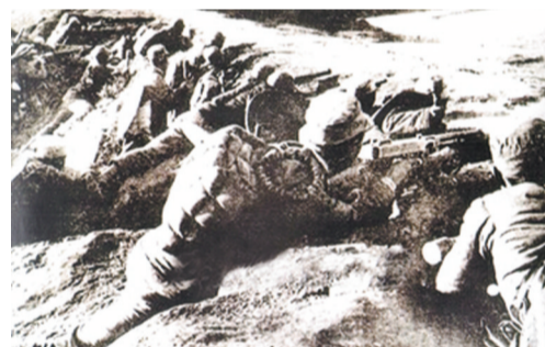
新四军四支队在蒋家河口歼灭日军小分队