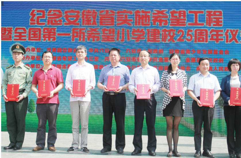
中国青少年发展基金会颁发荣誉证书