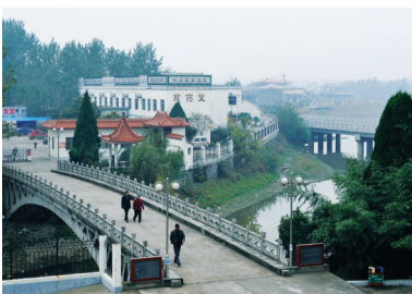
泗县中医院煎药室

在加强中医药文化建设方面，突出中医药特色与优势。院徽、院训等核心价值观充分体现了中医药文化特色和内涵。综合目标考核管理规定中有体现中医药文化的内容和要求。医院逐步形成了富含中医药文化特色的服务文化和管理文化体系。此外，医院从内部装饰、诊疗环境、医院标识、庭院等环境方面加强中医药文化宣传，体现中医药文化特色。悬挂有中医名人肖像、中医名言警句，中医文化特色的牌匾。