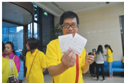
进入现场前买几注双色球

直播前,两位幸运代表在大家的见证下选出了当天的摇奖用球,并在公证文件上签字。在代表们和公证人员的监督下,两位开奖工作人员用各自保管的钥匙和密码从保险箱里取出摇奖球箱,交给公证员。代表们观看了公证人员检查球箱的封存情况,确认封存完整后,公证员当众打开摇奖球箱,并监督工作人员将号码球一一放入摇奖机。随后全场手机关机,开始进入直播。