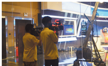
媒体镜头对准开奖现场