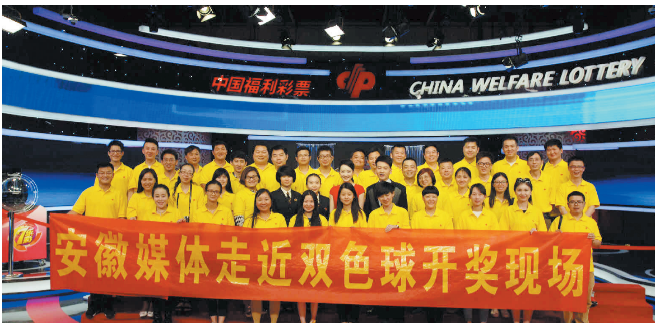
安徽媒体团走近双色球