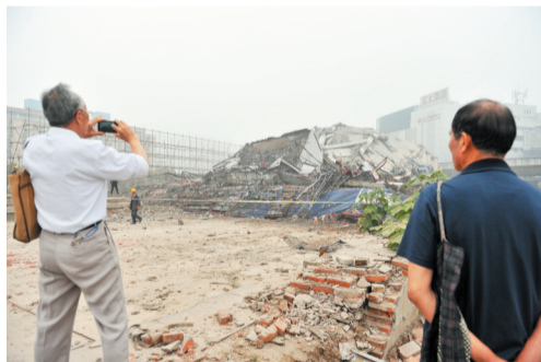
5月19日，不少对大楼有着情结的老人到现场观看