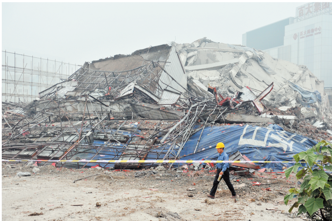
大楼爆破后倾倒在预定的范围以内