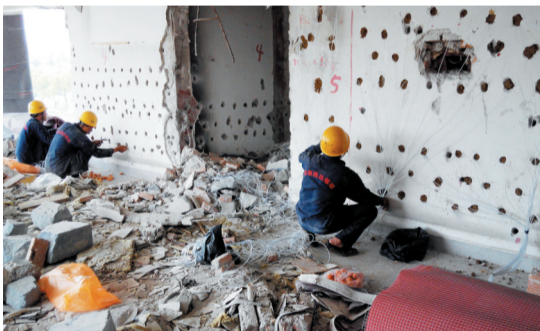
5月17日，工作人员在进行布线和炸药填充