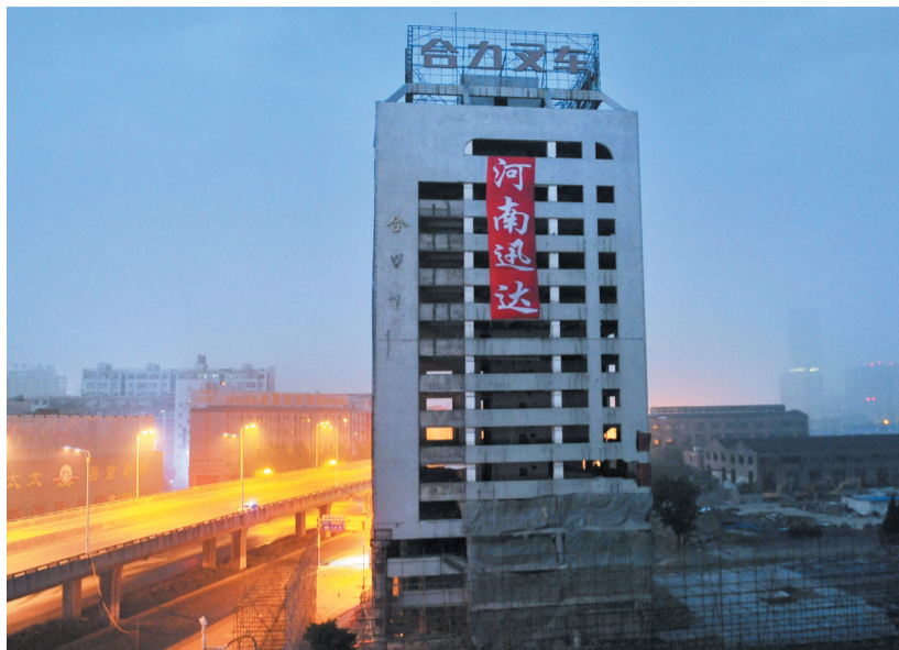
5月19日凌晨4点半，合力叉车厂大楼进入爆破倒计时1小时。