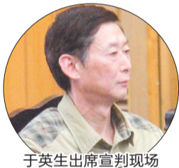
于英生出席宣判现场