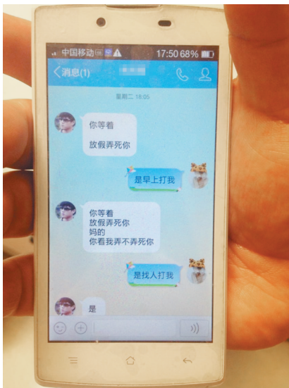
小佳发来的威胁信息