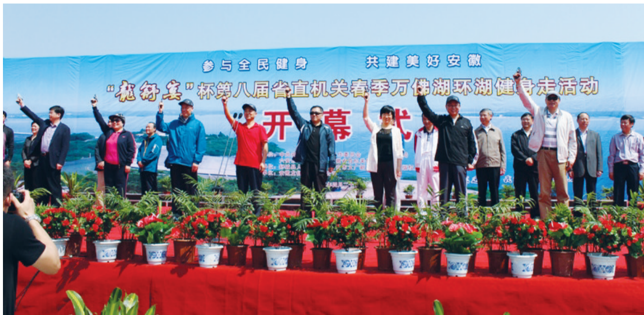
开幕式上，有关领导鸣枪发令

星报讯 （记者 周卫星/文）阳光明媚，领略湖光山色；春暖花开，倡导全民健身。4月25日上午，舒城万佛湖畔春意盎然，彩旗招展，省直机关环湖健身走活动开幕式在此举行。