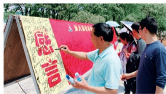
运动员走完全程后签名留念