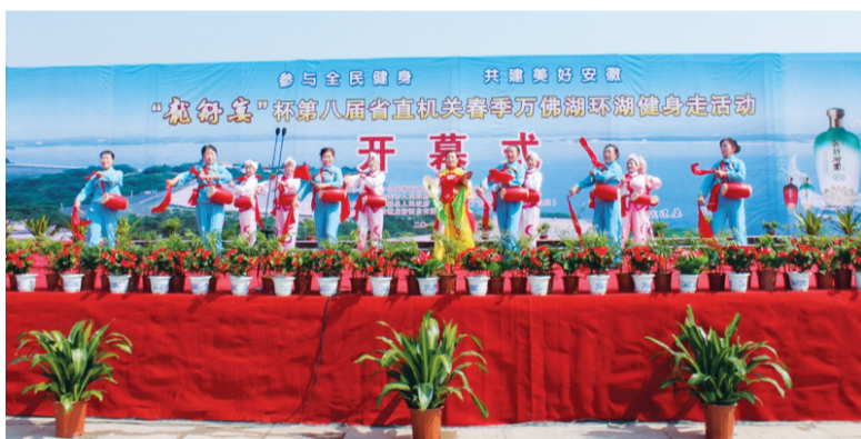
开幕式上的欢乐锣鼓表演

工作之余锻炼身体，对身体、对工作都有好处，我们公务员平时坐办公室比较多，通过活动也能增强感情交流。希望以后能经常举办类似的活动。