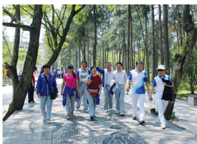
走向终点，胜利在望