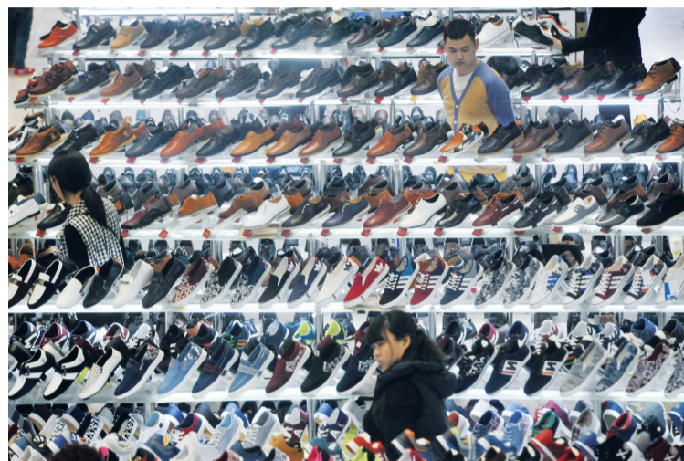
近日气温升高,各类单鞋开始热销。在合肥一服装批发城,成批的轻质鞋类摆上柜台供顾客挑选,销售火爆。

方圆支承和*ST国通是上市皖企亏损的“常客”。2013年度,以回转支承的制造和销售为主业的方圆支承,亏损了3000多万;去年,公司将亏损扭转了过来,净利达到了208万元,但紧接着,一季度又出现446.3万元的亏损额。*ST国通2013年度净利464万元,去掉“帽子”后,去年再度亏损2800多万元,导致公司又重新“戴帽”,且今年一季度亏损也达到了400万元。