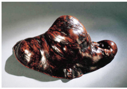
天然瘿木材质贝光

对于许多人来说,贝光听都没有听过。它是一种极为稀见的汉族传统文房用具。最初当是以贝壳所制,用来研光纸张的,故称之为“贝光”。研光也称为压光,是一种古老的汉族造纸和染整传统技艺,用卵形、元宝形或弧形的石块碾压或摩擦皮革、布帛、