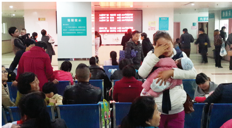
昨日,在安徽省立儿童医院,前来就诊的儿童患者很多。