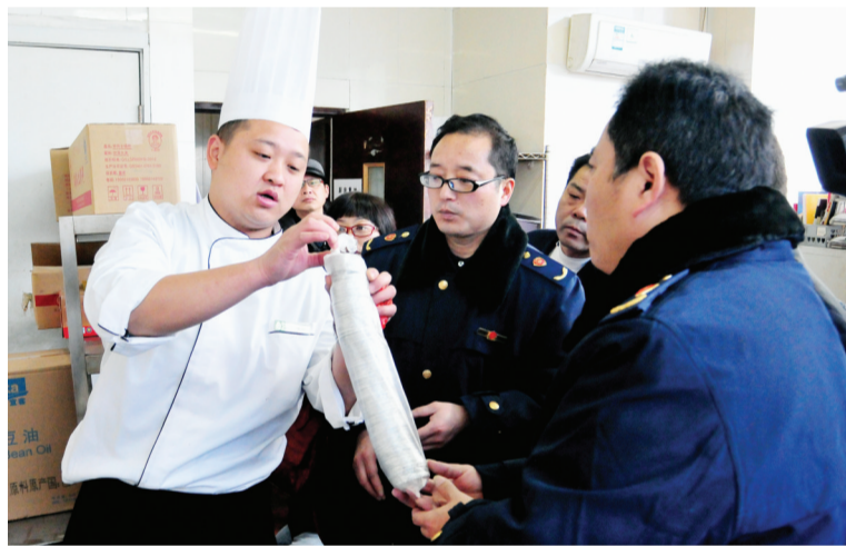
餐饮单位基本情况、年夜饭预订桌数,实际能承办桌数、年夜饭菜单进行了登