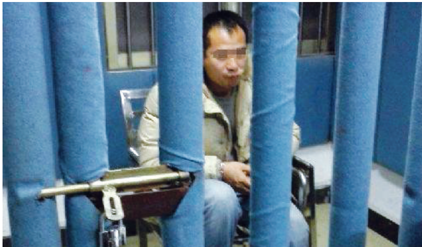
其中一嫌疑人已经落网