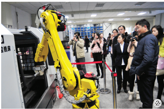
①餐厅服务机器人 ②机械加工机器人 ③情感智能机器人