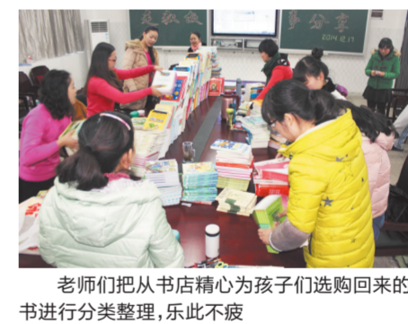
老师们把从书店精心为孩子们选购回来的图书进行分类整理，乐此不疲

…… 正因为所有老师们的辛勤耕耘，包河区艺体教师服务中心才会闪烁着熠熠生辉的光芒，如同满天繁星照耀天空。