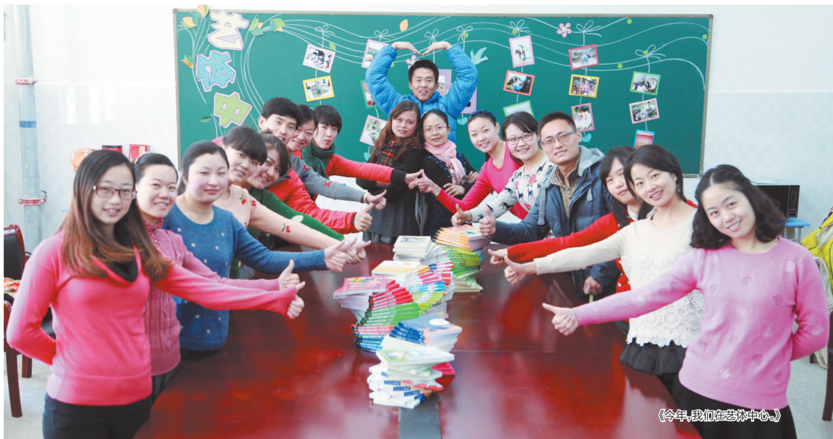
《今年，我们在艺体中心》