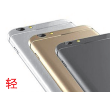
轻 129g轻而厚实,无以挑剔

果六采用原厂供应商外壳及按键,一体化机身、手感好,重量适中。外观相似度极高。这款手机做工精细,可以与原版机的做工相媲美。采用一体贴合屏,长时间使用不会进灰。外壳