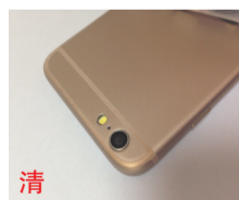
清 极致高清摄像,画面完美无缺