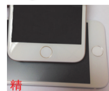
精 1:1精工细作,4.7寸精美绝伦