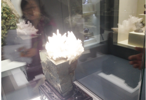
镇馆之宝(黄铁矿与石英的结合体,暂时无名)