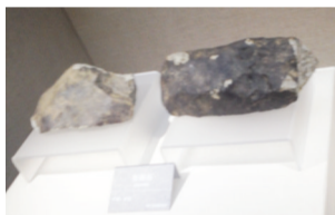
庐江1994年发现的陨石