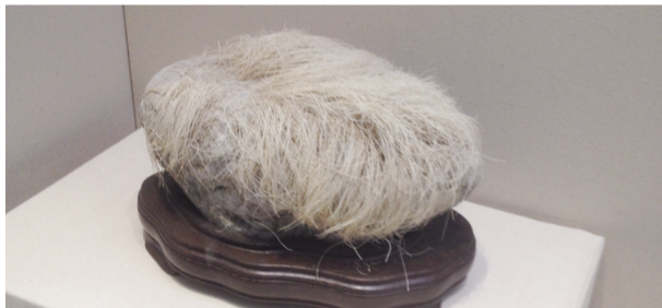
来自台湾的头发石