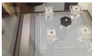
价值一栋公寓的亚历山大变石