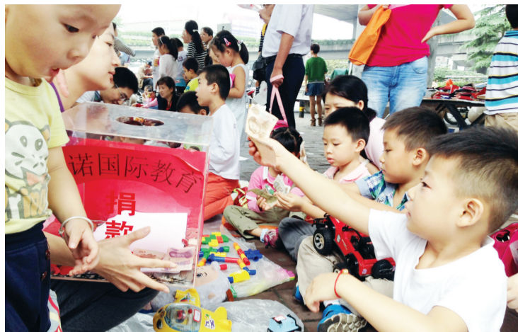
13日、14日两天，省城近五百名小学生在家长的陪同下汇聚马鞍山路家乐福门前广场，举行义卖活动。据主办单位介绍，孩子们在现场将自己的玩具和书籍等进行义卖，所得钱款现场捐献给岳西县的希望小学。

“如果我有一个芭比娃娃，我会像小姨照顾我一样照顾它。”她说，等她长大了，她还会好好照顾外公外婆和小姨，“他们都对我好。”