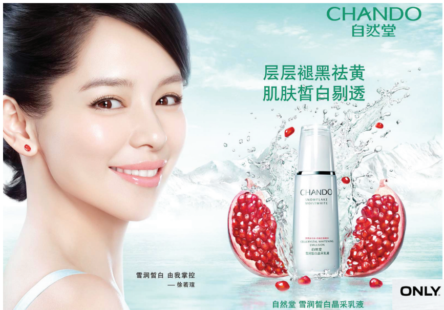
雪润皙白 由我掌控 一徐若瑄

大自然有多少奇迹,自然堂就带给你多少美丽奇迹。12年来,自然堂孜孜不倦,不懈发现并破译大自然的美丽奇迹,并不断精研消费者需求,突破护肤瓶颈,为东方女性带来高效而安心的呵护。为不同肌肤提供滋润、美白、修护、抗氧化功能,缔造凝润、晶透、幼滑的天宠冰肌肤。