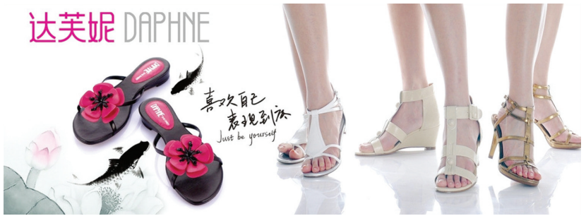
特别鸣谢合肥百大商业大厦对本版内容的大力支持! 本版文字 董方

“达芙妮”名字来源于希腊神话,所以达芙妮的设计运用了很多希腊元素。于1990年集团创立自有品牌“达芙妮”,制造及销售女装鞋类,成为中国最成功之国内品牌之一,连续多年获赠最畅销国内产品之荣誉。