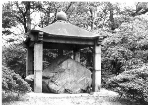
现存于日本皇宫的“唐鸿胪井刻石”

史载,唐鸿胪井刻石本是一块重逾9吨,单体十多立方米的驼形天然顽石。公元713年(唐开元元年),唐玄宗使鸿胪卿崔忻前往辽东,册封靺鞨首领大祚荣为渤海郡王。使命完成后,崔忻原路返回长安,路经旅顺都里镇,为纪念这次册封盛事,于黄金山下凿井两口、刻石一块,永为证验。刻石文字共29字,分3行自上而下自右向左书写: