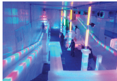
【天鹅湖万达7.20双周年|全年最大感恩回馈12014仅此1天】冰雪童话呈现——500吨极地冰堡,零下7℃,真冰冰雕,合肥首展启幕!

有关部门回应称,此前媒体有关“技术人员分析麻雀可能是撑死的”报道不实。据调查,没有技术人员向记者分析过麻雀死亡的原因。另据介绍,巫山县已对该批大米进行了原地封存,没有流入市场销售。