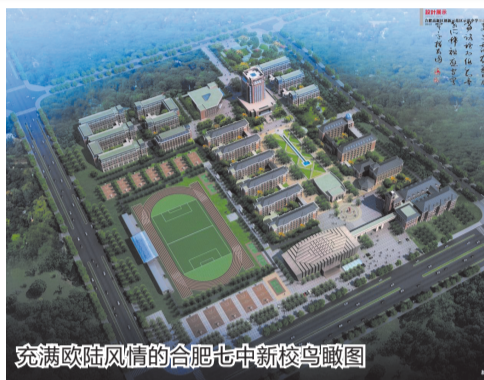
充满欧陆风情的合肥七中新校鸟瞰图

校园信息化、数字化建设高投入、高起点，对接当前最领先水平，满足未来现代化教育教学和管理的所有要求。新校文化建设和新校建设同步实施。