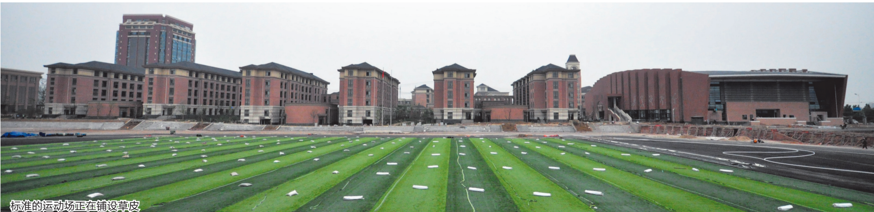
标准的运动场正在铺设草皮