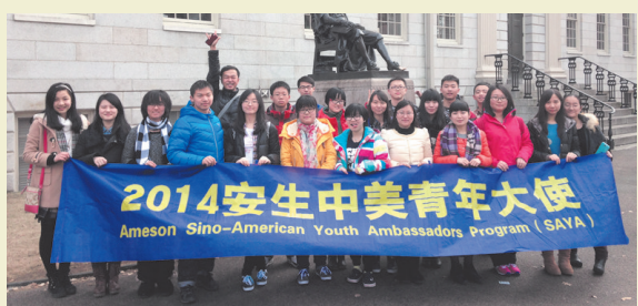
合肥一中学生参观耶鲁大学