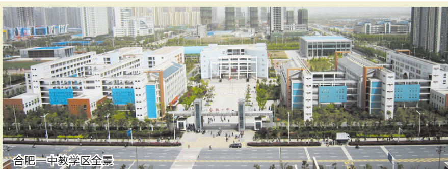
合肥一中教学区全景