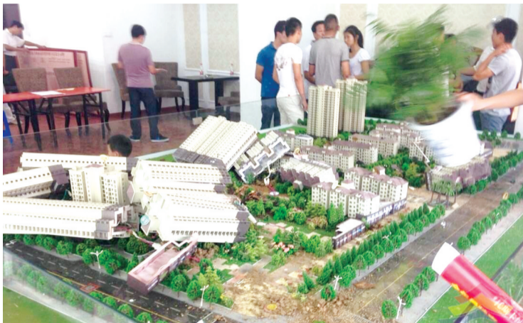
售楼部的沙盘被毁坏