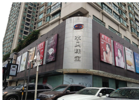
●深圳水贝大大小小的珠宝加工厂1600多家。一位知情人士透露,很多商家打“意大利工艺”、“比利时切工”,其实都是深圳造。

一位业内人士告诉笔者,一般小珠宝商,经济能力有限,都到批发市场拿现货,批发商要赚一些,一般在成本上加价10%-15%批发,如果是委托珠宝工厂加工,会更便宜。