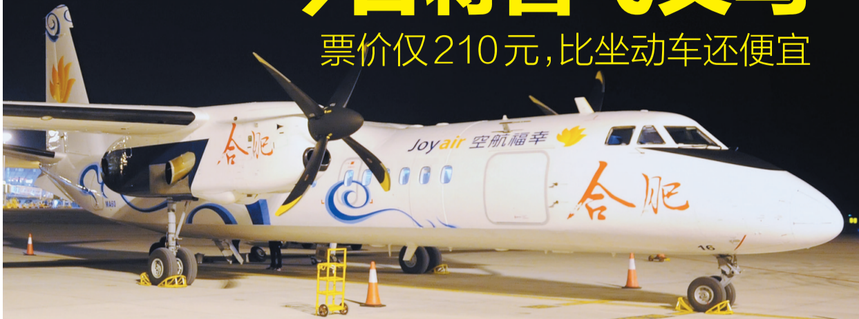
降落在新桥机场的“合肥号”

星报讯(翟玉婷 记者 祝亮/文 程兆/图) 首架以合肥城市命名的飞机“合肥号”于昨晚9时许抵达新桥国际机场。今日,它将揭开神秘的面纱,展现在合肥市民面前。当日,它还将从新桥起航,执行首飞,前往浙江省义乌市。