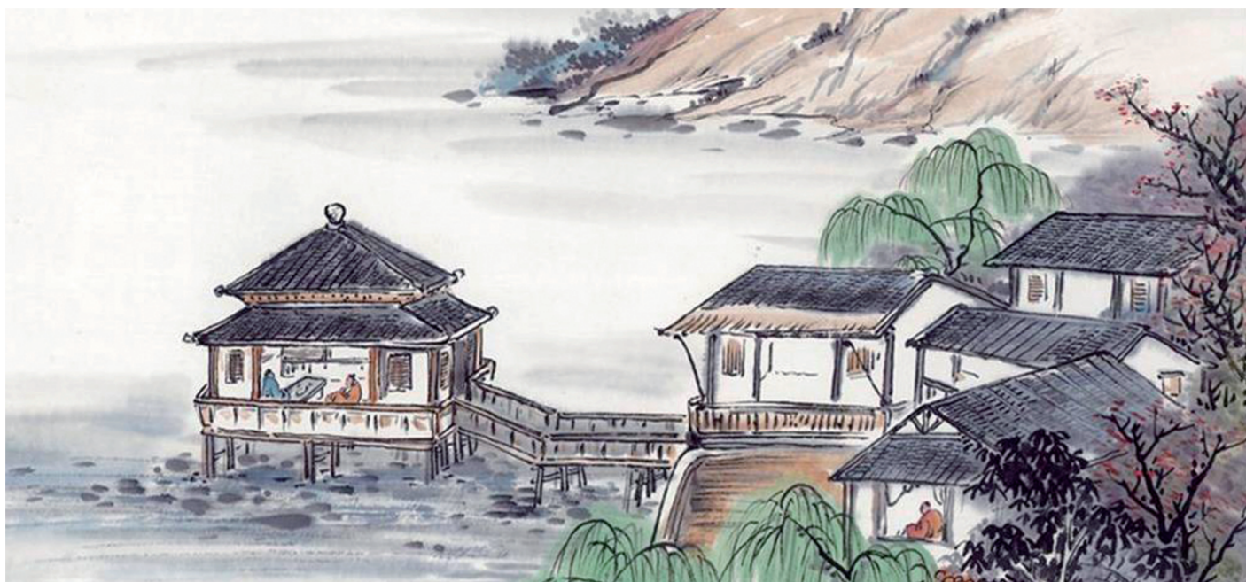
资料图片：把酒话乡情

安徽是中华民族的发祥地之一，众多遗存显示了文明的久远。无数先贤在徽皖大地创造着种种神奇。安徽徽印象酒业有限公司与本报联手打造的“寻找徽印象”栏目将探寻安徽文明之源，全新展现安徽文明之光，寻找历史的记忆，寻找身边的美景。请您用笔和镜头记录安徽大地上的历史遗存、自然风物、艺术珍奇、非遗技艺、故事传说，作品将进行评选，颁发奖品和证书，并集结出版。稿件请投 903552062@qq.com，咨询热线 18656158321。