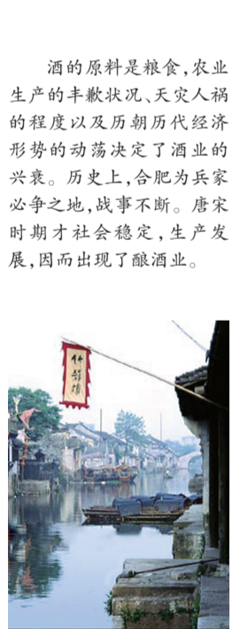
资料图片：庐州街景