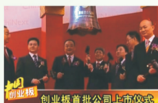
爱尔眼科医院集团成功上市