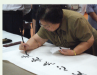
中国红十字会原会长视察爱尔