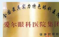
被评为中国最具实力特色眼科医院

EYE 爱尔眼科医院 AIER EYE HOSPITAL (爱尔眼科股票代码: 300015)