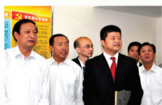
卫生部副部长调研合肥爱尔