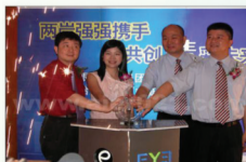
与台湾大学眼科深度合作防治盲