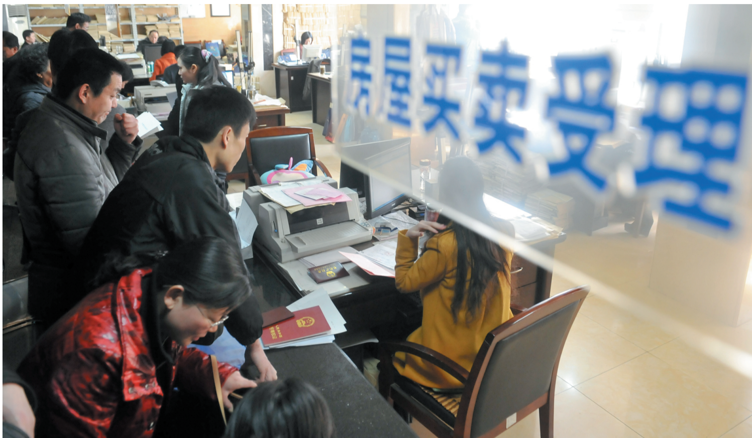
办税交易大厅挤满了前来咨询、交易的市民