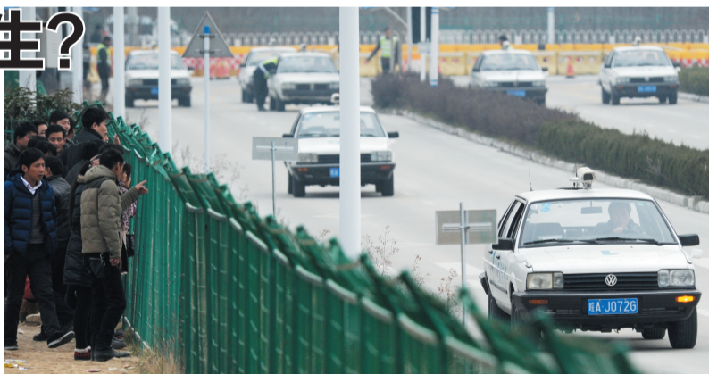
1月7日合肥路考现场

过的考试是科目二和科目三(大路考),科目一只需要背好复习题,在网上反复练习几遍,通过考试的几率就在90%以上,但从两天的考试结果看,科目一的考试合格率最低,以往的简单科目变成拦路虎。