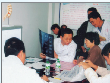
骨科专家现场会诊