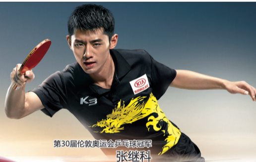
第30届伦敦奥运会乒乓球冠军 张继科