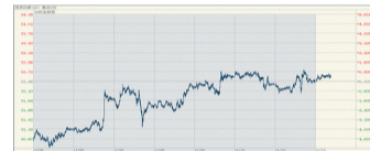
现货白银11月5日-11月14日分时走势图