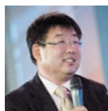
哈佛大学博士后,曾任国金证券首席经济学家、湘财证券首席经济学家

太多人在谈经济减速时,操心的程度跟领导绝对有一拼。其实经济增长快点慢点真无大碍,波浪式发展更有持续性。咱不能速度快了就批GDP挂帅,速度刚慢一点又惊慌失措叶公好龙吧?其实从全球看,很多国家经济出现大动荡都是因房地产泡沫诱发金融危机。我们不可该防的不防,狼不来的高速路上整天琢磨怎么打狼。